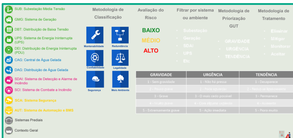
Figura 1: Riscos monitorados pela Companhia

São analisados os riscos de acordo com sua mensurabilidade, redundância, confiabilidade, legalidade, segurança e meio-ambiente, com avaliações entre baixo risco, médio risco e alto risco, conforme a Figura 1 abaixo. Tal avaliação é importante para balizar as estratégias de mitigação de riscos da Companhia.